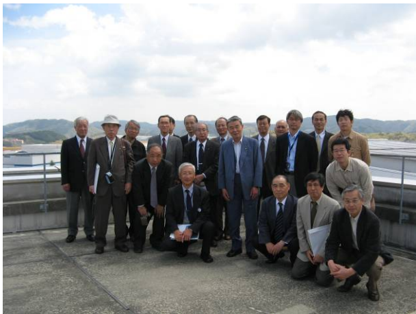
スプリング8中央管理棟の屋上