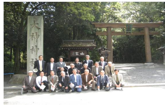
三輪山大神神社鳥居前