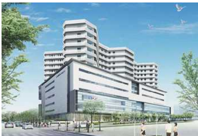
大阪府成人病センター完成予想