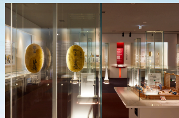
造幣博物館