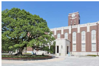
京都大学 吉田キャンパス

技術士専門分野の融合による新たなイノベーションへ ～世界水準・最先端技術力保有の京都で～