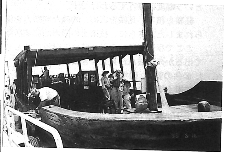
湖底に埋もれていた太古の 船を大きさ4倍に復元した 遊覧船が湖上を往来する